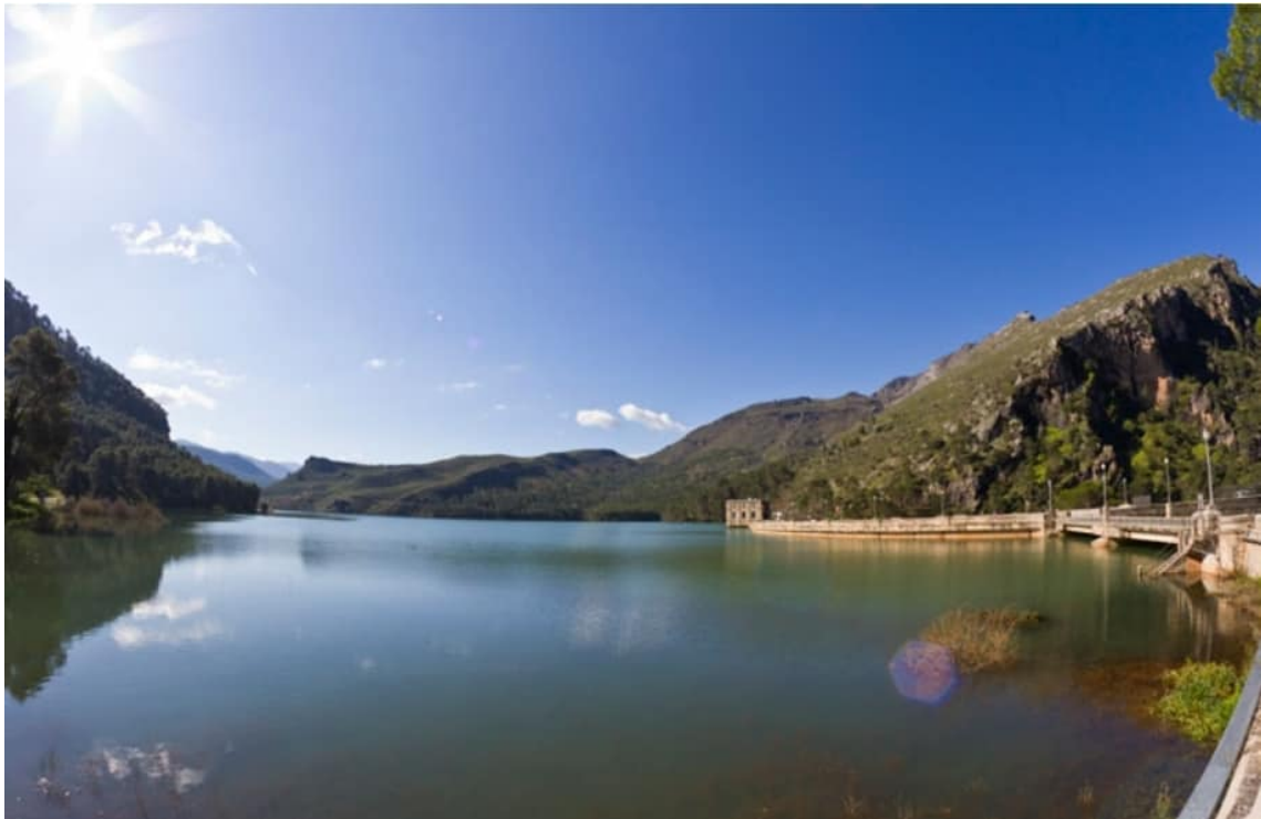
Embalse del Pantano del Tranco (Sierra de Cazorla)

Gran Fondo Sierra de Cazorla 145 KM – 2090 D+