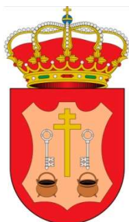
Peal de Becerro