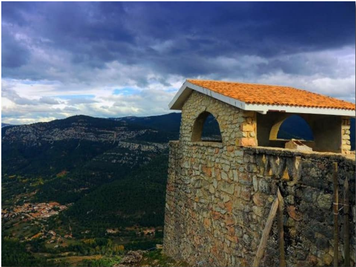
Mirador Puerto de las Palomas (Sierra de Cazorla)