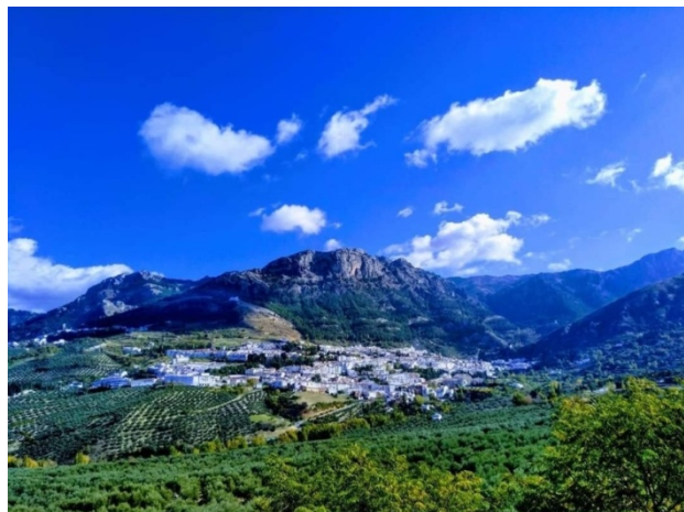
Municipio Turístico de Cazorla